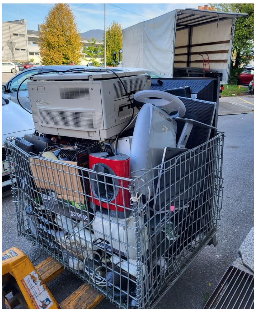
Slika 2: Polna mrežasta paleta ob enem odvozu aparatov izpred OŠ Šentvid

Največ malih aparatov na učenca je zbrala Osnovna šola Šentvid , in sicer 3.591,5 kg malih aparatov oz. 9,4 kg na učenca (od tega 436,5 kg še delujočih).