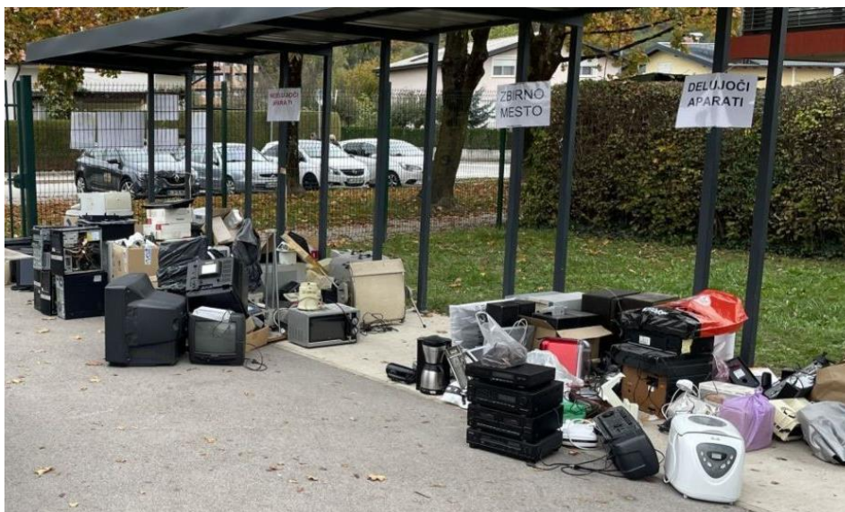
Slika 1: Del zbranih aparatov pred OŠ n.h. Maksa Pečarja

Največ malih aparatov na učenca je zbrala Osnovna šola Šentvid , in sicer 3.591,5 kg malih aparatov oz. 9,4 kg na učenca (od tega 436,5 kg še delujočih).