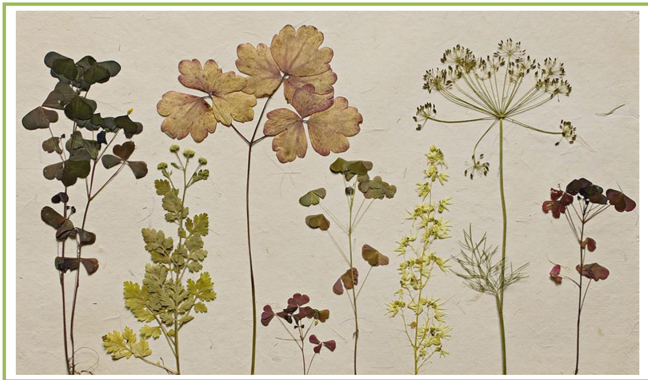
POSUŠENE IN STISNJENE RASTLINE

Rastline, ki jih naberemo, običajno na kraju rastišča shranimo v vreče iz umetne mase in čim prej prenesemo v prostor, kjer jih posušimo. Tak prostor mora biti suh in topel. Rastline je treba stisniti (obtežiti), ponavadi med knjige ali podobno. Pri sušenju rastline moramo preprečiti plesnitev. Papir, v katerega vložimo rastlino, je zato treba nekajkrat menjati, saj na ta način preprečimo zastajanje vlage.